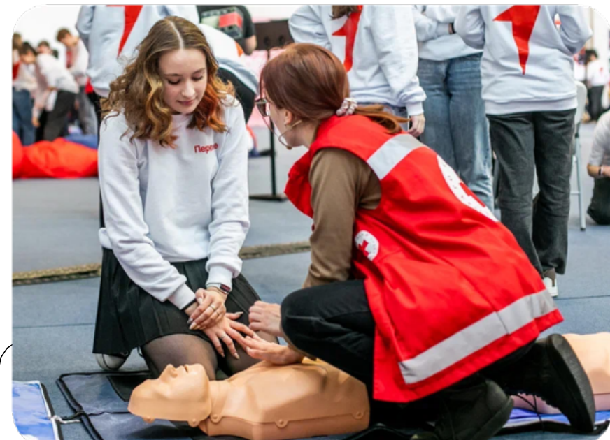
ВЗАИМОПОМОЩЬ И ВЗАИМОУВАЖЕНИЕ