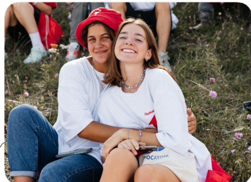
ДОБРО И СПРАВЕДЛИВОСТЬ