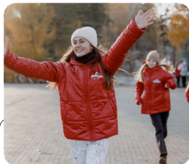
ЖИЗНЬ И ДОСТОИНСТВО