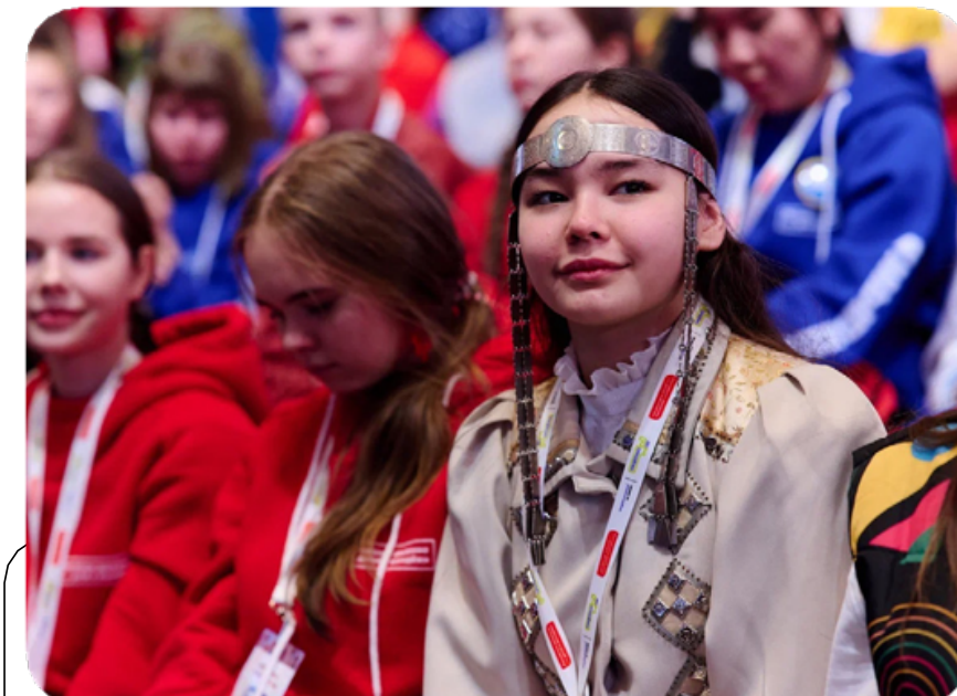
ЕДИНСТВО НАРОДОВ РОССИИ